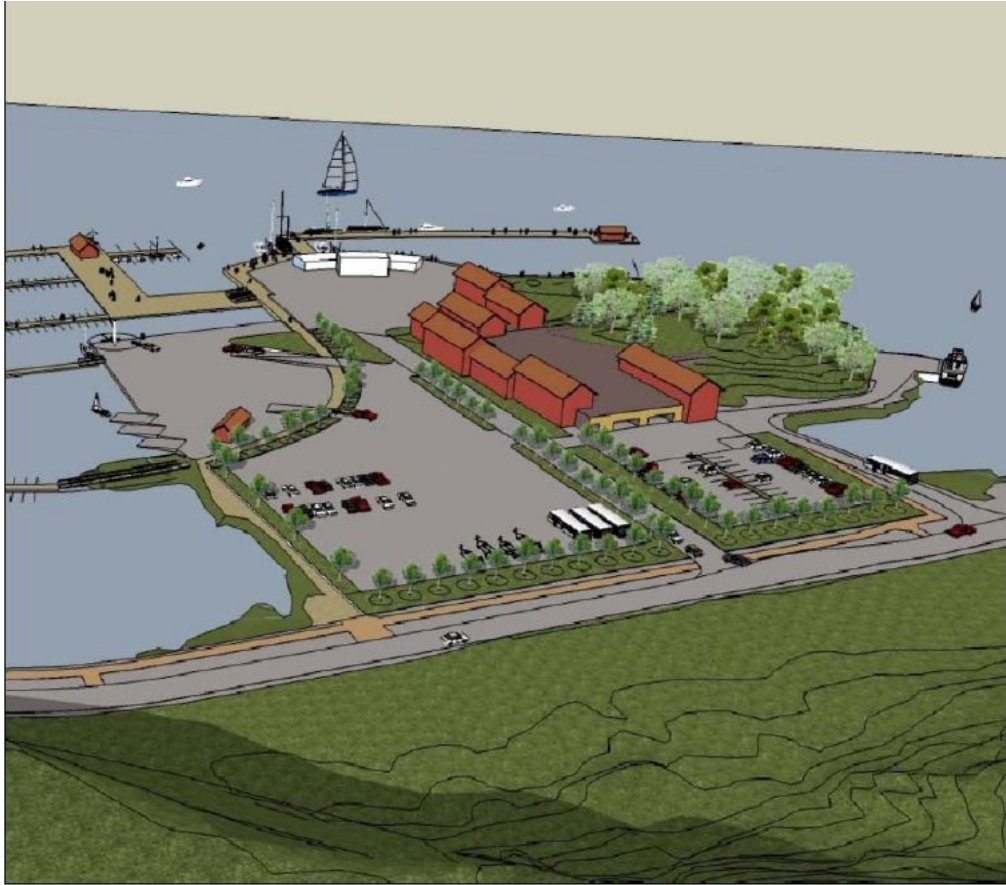
Figur 15. Prinsipper for framtidig utvikling av Furuøy. Fugleperspektiv fra øst (Illustrasjon Bjar Arkitekter AS).