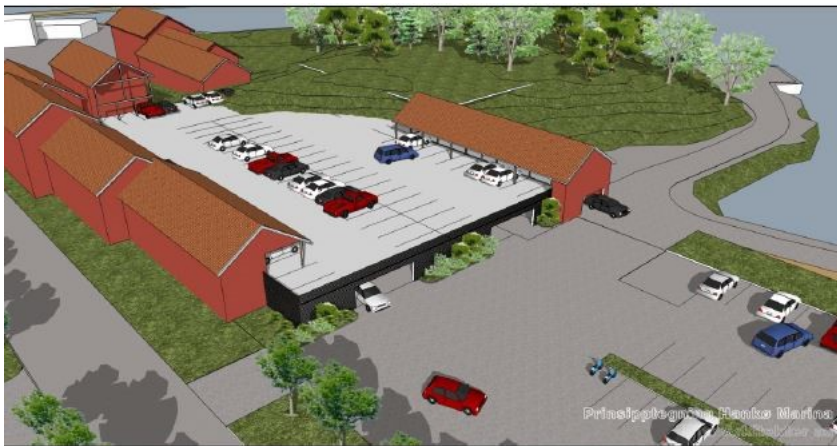
Figur 16. Mulig utforming av parkeringshus. Selve p-huset "kles" med bygninger som oppføres i et tradisjonelt arkitektonisk uttrykk, og som kan huse for eksempel små butikker og enkle overnattingsmuligheter. Parkerte biler på takplan blir ikke synlige sett fra terrengnivå (illustrasjon Bjar Arkitekter AS).